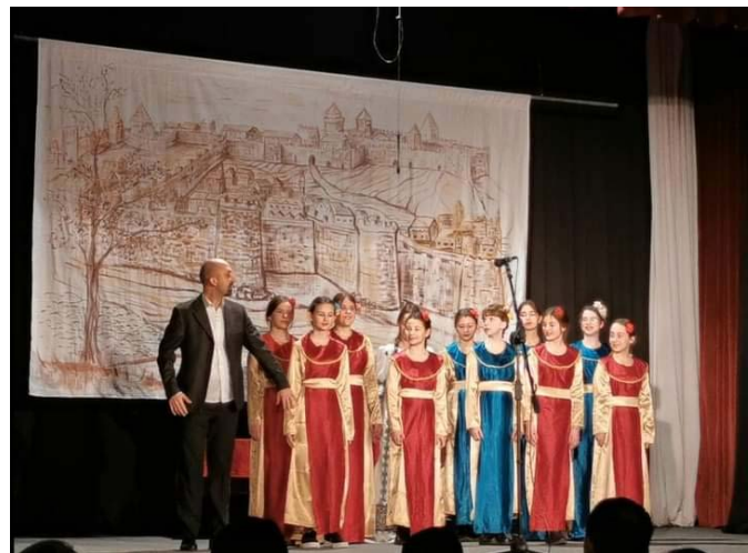
Манифестација "Српчад Србији" Пале, Р.Српска