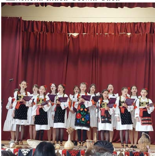
Изложба славских колача