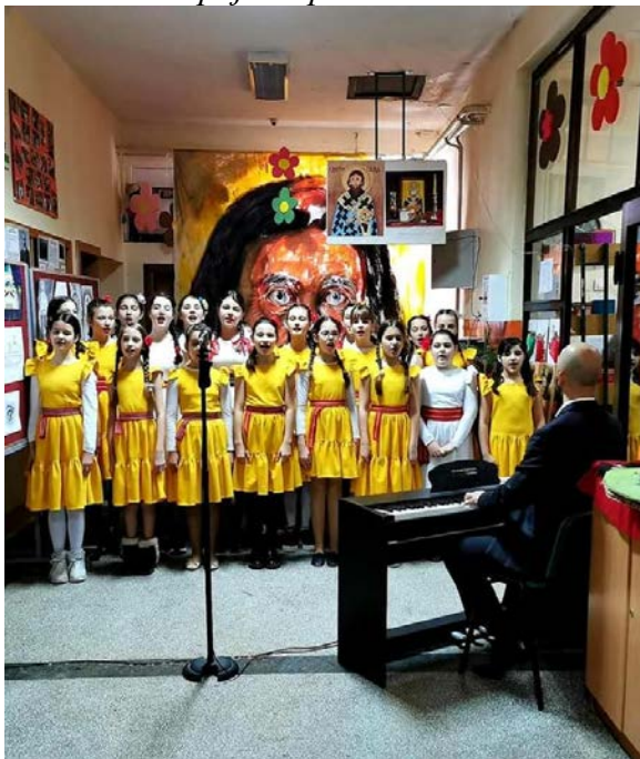
Школска слава Свети Сава