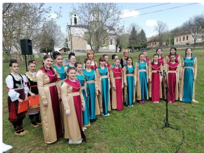
Сусрети села Србије