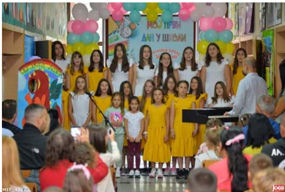
Свечани пријем првака